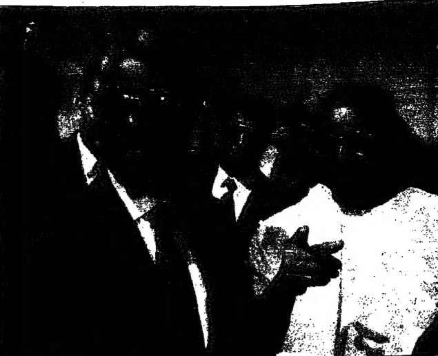
الأمين العام للأمم المتحدة يزور ليبيا الخميس والجمعة

■ الرباط: قال في إحدى المقابلات التي أجراها مع عدد من المسؤولين في الجبيلات العظمى، رئيس جمهورية الكويت عبد الله الأحمد الصباح، إن الوضع في الجبيلات العظمى ليس مستقرًا، بل إنه يشهد تدهورًا مستمرًا، وذلك في ظل غياب أي حل سياسي يرضي جميع الأطراف المعنية. وأضاف الأحمد الصباح، إن الوضع في الجبيلات العظمى يشهد تدهورًا مستمرًا، وذلك في ظل غياب أي حل سياسي يرضي جميع الأطراف المعنية.